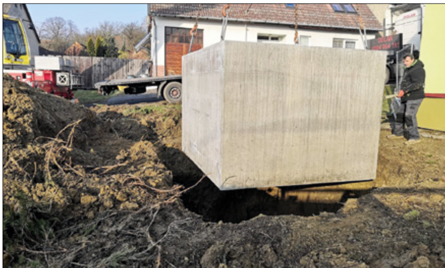
Nádrž na dešťovou vodu u knihovny ve Lhotce.

neničili práci druhých, a využívali pro uložení svého veškerého odpadu sběrný dvůr. Věřte, že ani ostříhané tují, ani vyhrabaný trávník do našich společných mezí nepatří. Dále se také tato skupina nadšenců pokouší o záchranu naší jedné z posledních slováckých bůd, takzvané Turzíkovy budy. Jejich zatím hlavním přínosem bylo vyčištění jejího okolí od náletových dřevin, vyklizení všemožného odpadu uvnitř budy, ale i zpevnění nosné konstrukce, částečná oprava