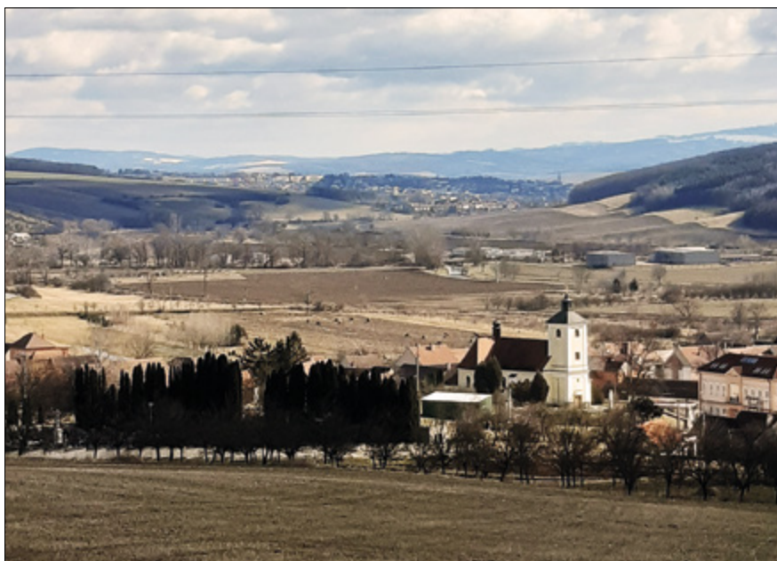
Jarní pohled na obec.