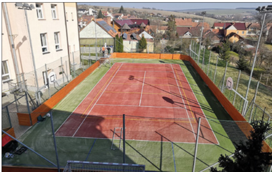
Hřiště za ZŠ.

střešního pláště a zabránění dalšímu chátrání této velmi cenné památky. Za tuto práci jim patří obrovské poděkování. Také jsem velmi rád, že se začínají hlásit občané, kterým se jejich práce líbí, a sami by chtěli přiložit ruku k dílu. Jako například naši včelaři, kteří v této práci vidí jak velký prospěch pro jejich včely medonosné, tak výchovný efekt pro naše malé včelaře. Ještě jednou děkuji a zároveň vyzývám stejně smýšlející občany, kterým není okolí naší krásné obce lhostejné a chtěli by přiložit ruku k dílu, aby se ozvali naší zatím malé skupině Slovácký Fénix. Dalším z mého pohledu krásným počinem je vyhlášení turistické soutěže Se skřítkem za skřítkem. Myšlenka pana Jirky Macka a paní učitelky Veroniky Jančové připravit soutěž pro naše děti a jejich rodiče, která je zajímavá jak splněním úkolů, tak i odměnou od obce HradčovicLhotka, je skvělá. Záměrem této soutěže je i poznávání zajímavých míst v našem katastru a myslím si, že i občané, kteří už nemají malé děti, by mohli tuto soutěž a s ní spojenou turistiku absolvovat. Procházka je to opravdu krásná a pro mnohé občany i zajímavá v poznávání nových míst. Najít například Junácký kámen nebo památnou Hrušku není zcela jednoduché. Vážení občané, závěrem Vám přeji krásné a duševně obohacující prožití Velikonočních svátků, také Vám přeji hlavně zdravý a pevný nervy se stále trvajících vládních opatřeními; a jak jsem již psal v minulých listech – jasnou mysl a pozitivní myšlení. Starosta obce