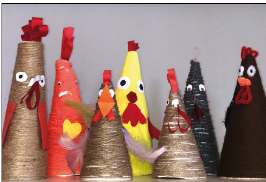
Slepice od žáků 5. třídy.