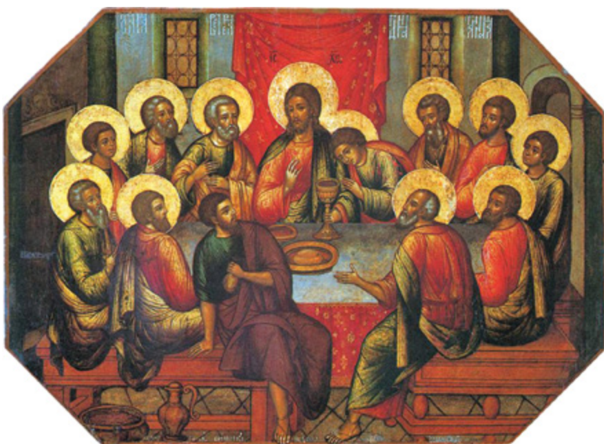
Semjon Ušakov (1685) – Poslední večeře Páně.

Ano jsou tu ti druzí, které chci milovat a jim důvěřovat. Ale jsou to také jen chybující lidé jako já. Může přijít a přichází zklamání, rozčarování z lidské nedokonalosti i té nešťastné smrtelnosti.