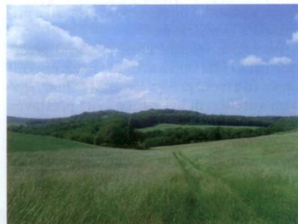
Pohled na Přírodní rezervaci Rovná hora

My, běžní turisté, ale většinou hmyzu příliš pozornosti nevěnujeme a vnímáme spíše krajinu. Zpevněná lesní pěšina nás vyvede na nádherně zvlněnou louku s posedem, jejíž okraj tvoří lesnatý porost. Vystoupáme po louce k nejvyššímu místu naučné stezky, který leží v nadmořské výšce 325 metrů. Nachází se u bývalého polního letiště. Postojíme tady chvíli, abychom se pokochali překrásnými výhledy na pohoří lemující obzor, na Bílé Karpaty, Vizovickou vrchovinu a Hluckou pahorkatinu, a pak pokračujeme dál. Naučná stezka končí v Drslavicích, ale my chceme